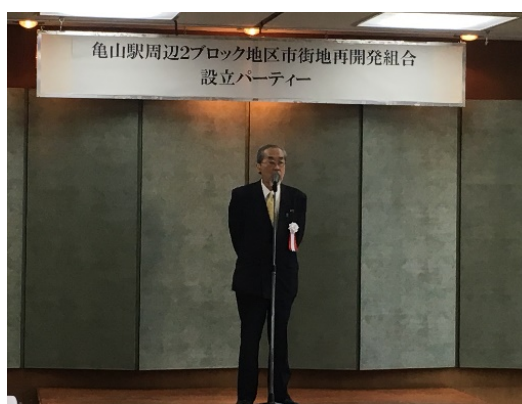
設立パーティーの状況